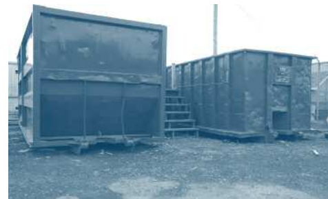
Deux sites disponibles jusqu'au 25 octobre