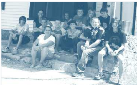
Les jeunes participants au camp estival qui avait lieu à Jeunesse 4 Saisons

Le conseil d'administration de l'Adrén'Ado profite de l'apport de deux nouveaux membres élus lors