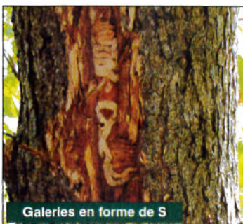
Galleries en forme de S

L'agrile du frêne est un insecte ravageur qui cause de graves dommages aux frênes. Originaire de l'Asie orientale, on l'a détecté pour la première fois au Canada et aux États-Unis en 2002. L'agrile a tué des millions de frênes dans le Sud-Ouest de l'Ontario, le Michigan et ses États avoisinants. Ce ravageur constitue une menace grave pour l'économie et l'environnement dans les zones urbaines et forestières des deux pays. L'agrile du frêne attaque et tue toutes les essences de frênes (sauf le sorbier d'Amérique qui n'est pas apparenté au frêne même si son nom commun anglais est mountain ash).