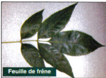
Feuille de frêne